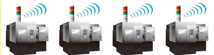
AirGRID Transmitter WDT-5R-Z2 Signal Tower LR5-302